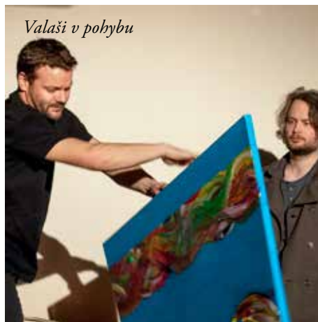
Valaši v pohybu