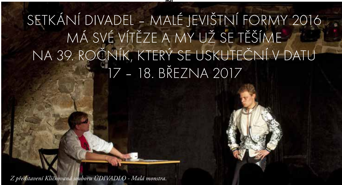
Z představení Kličkována souboru ÚDIVADLO - Malá monstra.

DOPORUČENÍ POROTY NA PŘEHLÍDKU MLADÁ SCÉNA ZDIVIDLA Ostrava „Zahradní slavnost – část 2. jednání“