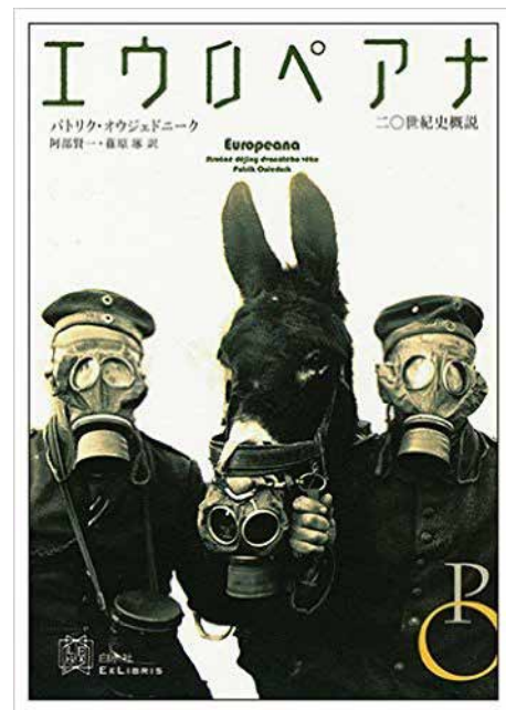
Europeana v Japonsku