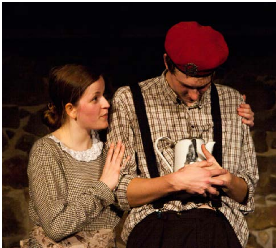
Z představení Helverova noc v podání souboru Červiven Senior