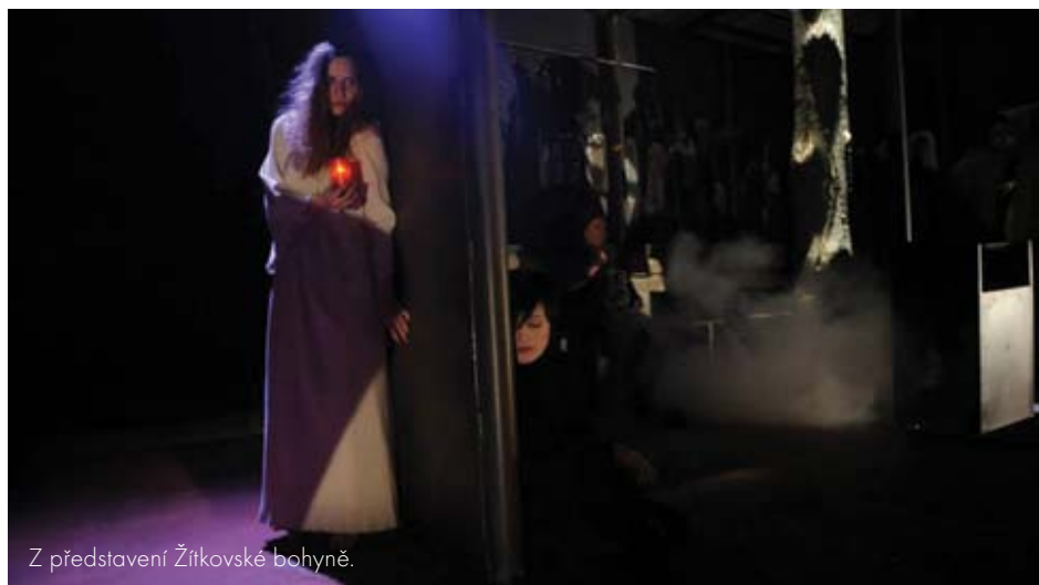
Z představení Žitkovské bohyně.