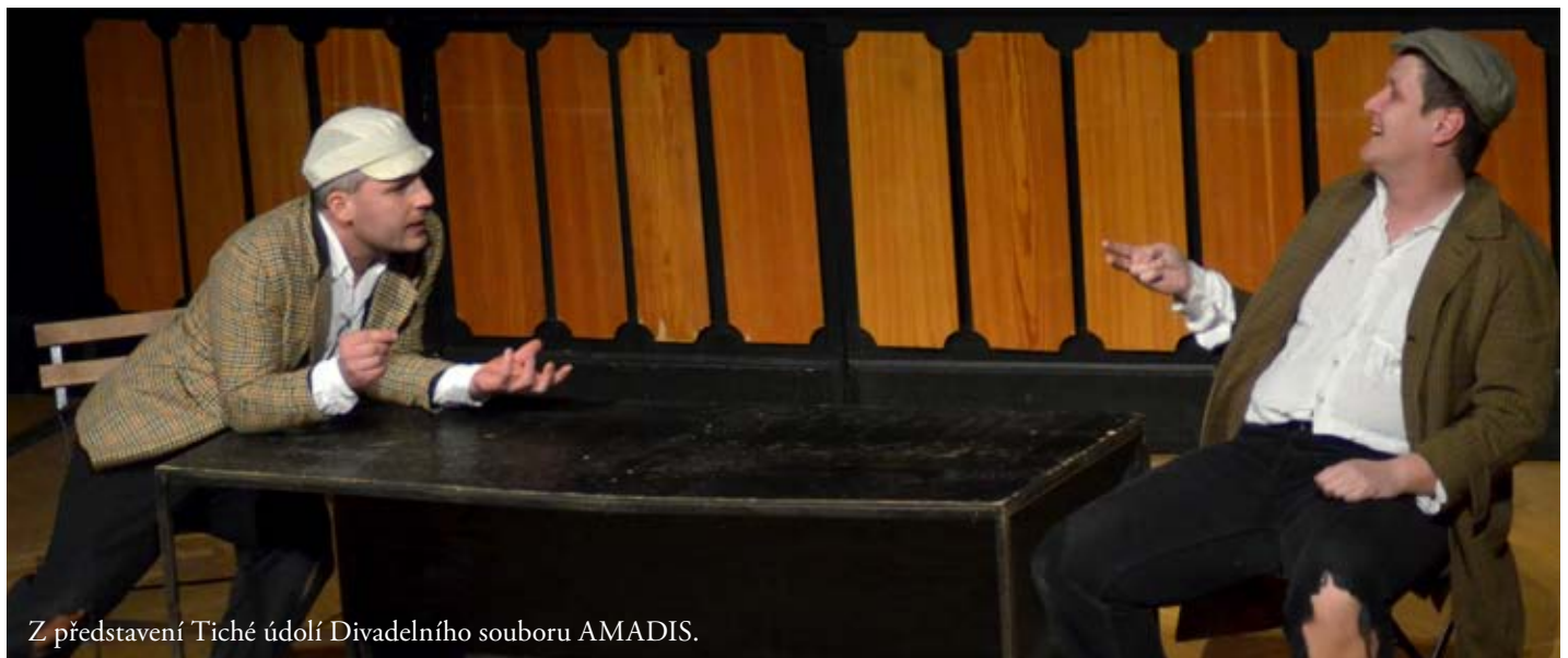
Z představení Tiché údolí Divadelního souboru AMADIS.