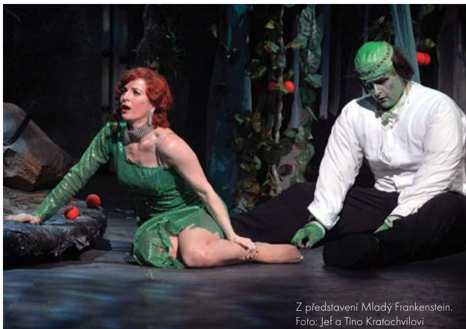
Z představení Mladý Frankenstein.

Když už jsem zmínila všemi opěvovaného Webbera, nemohu opomenout dlouho připravovaného Fantoma Opery . Tento celosvětově úspěšný muzikál se původně v Česku hrát