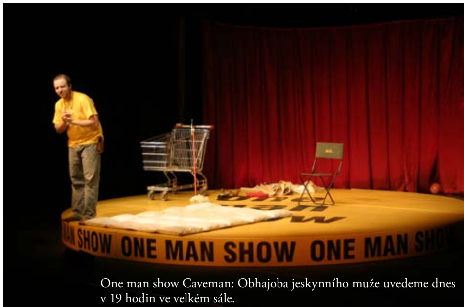
One man show Caveman: Obhajoba jeskynního muže uvedeme dnes v 19 hodin ve velkém sále.