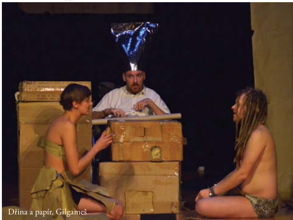
Dřina a papír, Gilgamesš

Původně jsem na toto představení nechtěla jít, protože redakční časový rozvrh mi nedovoluje vidět vše. Naštěstí se mi ale podařilo na chvíli uvolnit a vidět větší část. Píšu „naštěstí“. To proto, že mi hra určitě prodloužila život minimálně o hodinu, jak jsem se krásně nasmála. Děj si živě sprintoval od začátku do konce, bez oddechu, s miliony postav a dvěma herci. Ze začátku mi dělalo problém se zorientovat, ale to mi nijak nebránilo v tom, abych si hru užila. Velká poklona, za autenticitu a minimální prostředky při rychlé změně rolí. Jako čistý laik bych řekla, že to nejspíš musí být velmi herecky náročné, včetně změny přízvuku a všeho okolo. A také bych dodala, že (nejspíše) improvizovaná situace se zlomenou židlí byla zvládnut natolik plynule, že nikterak