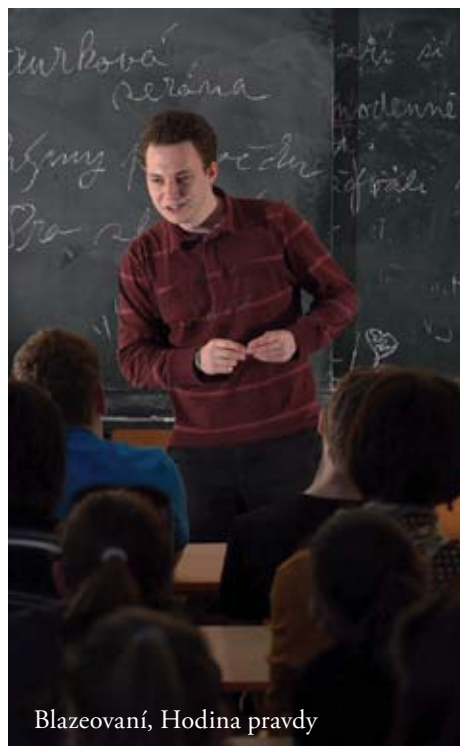
Blazeovaní, Hodina pravdy