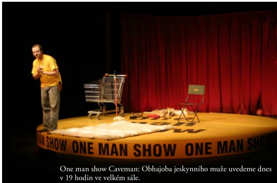
One man show Caveman: Obhajoba jeskynního muže uvedeme dnes v 19 hodin ve velkém sále.