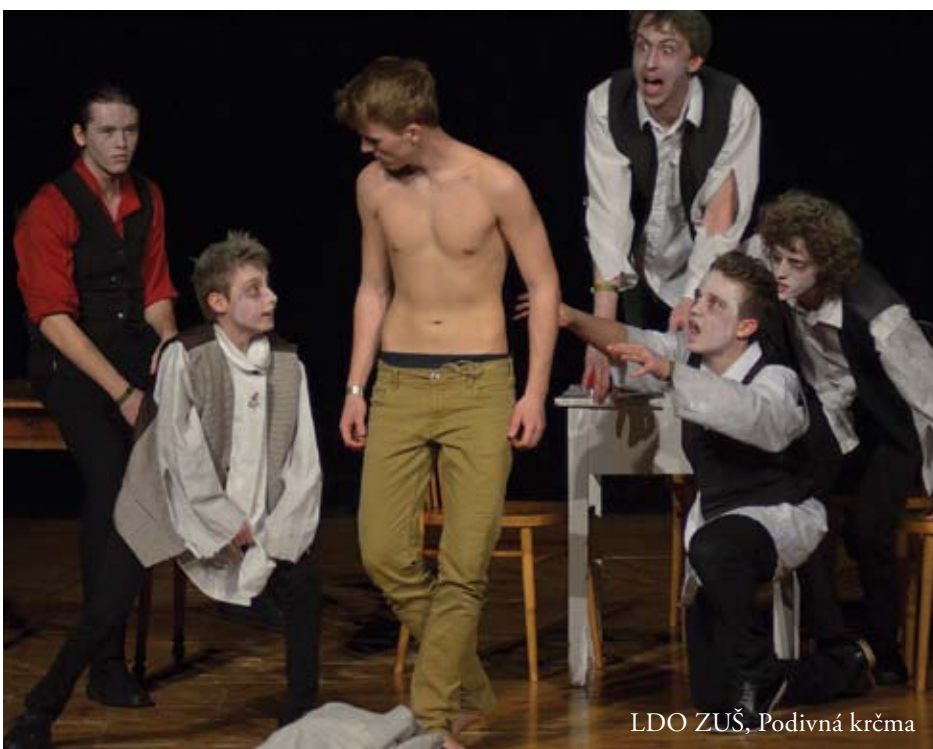
LDO ZUŠ, Podivná krčma

Bohužel, z tohoto představení jsem nestihla víc, než prvních pár minut. Je mi to líto, protože příběh vypadal zajímavě a vážně bych chtěla vědět jeho pointu. Můj osobní dojem ze začátku je ten, že mi připadal trochu rozsekaný, ale vzhledem k tomu, že nemám komplexní náhled, nemohu to plně posoudit. Hercům bych