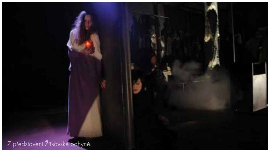
Z představení Žitkovské bohyně.