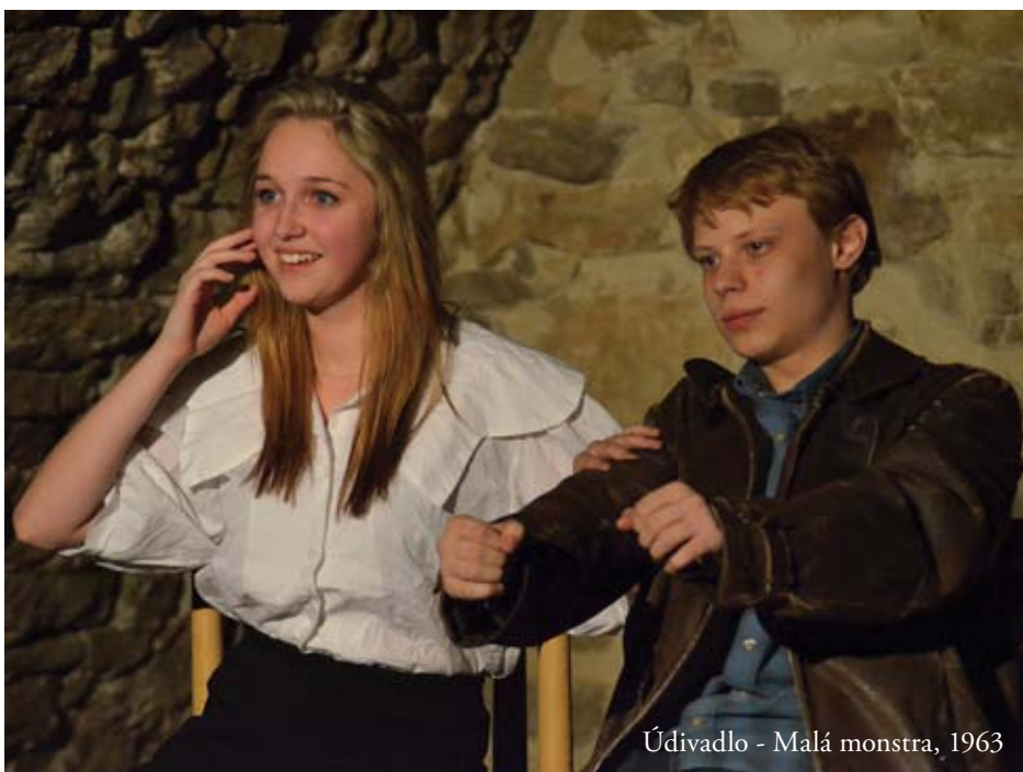
Údivadlo - Malá monstra, 1963

Popravdě, u tohoto výstupu nevím, co si myslet. Jako pohádkově hororové představení pro základní školu by to bylo skvělé (pokud by se tedy děti nebály až moc), protože herci se snažili o jasný výraz