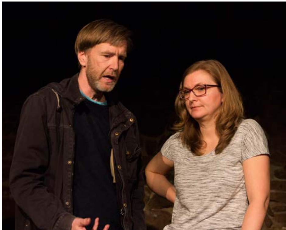
Soubor Láhor/Soundsystem získal díky hře Než hanba začne fackovat druhé doporučení na Šrámkův Písek.

LÁHOR / Soundsystem předvedl hru s názvem Než hanba začne fackovat druhé. Hned z úvodu nám bylo předvedeno, jak to vypadá, když se porvou dva klauni. Před dětmi. V nemocnici. Samozřejmě z toho bylo haló, nicméně dětem se to líbilo, a to je hlavní. To bohužel nebylo vše, neboť se nám postupně odkryl původní důvod této bitky, jenž spočíval v impotenci jednoho a neúmyslné nápomoci druhého. To, že se to stalo na klaunském vánočním večírku a každý vypadal jako klaun, je dost silné alibi, avšak dítě z toho vzniklo a s ním i problémy. Abychom nebyli tak vážní, byli jsme pobaveni krásným tancem na stole, jenž jeden z herců násled-