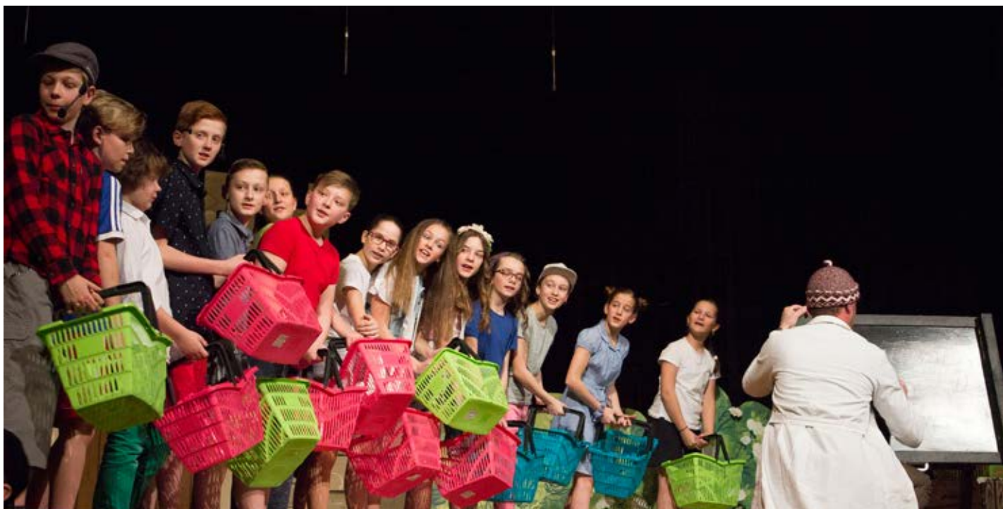
Sobotní program přehlídky zahájilo školní divadlo Žert ZŠ Žerotínova svým zpracováním pohádky At' žijí duchové .

Divadlo je bránou do jiného světa, kde v roli mlčenlivého pozorovatele sledujete dění na jevišti. Tragédie, komedie, amatérské divadlo, nebo recitace básní... Je spousta druhů vystoupení, které můžete absolvovat a najít si mezi nimi to pravé pro vás. Poté si jen sednete ke stolu s vínem nebo pivem, brambůrkami a můžete vypnout od okolního světa. Divadlo má uhrančivé kouzlo, které se kolem vás pomalu omotá jako chapadlo příliš vtíravé chobotnice a už nikdy vás nepustí. Jistě tohoto zážitku nebudete litovat a s nadšením si objednáte místa na další představení. Nutno upozornit, že nejlepší je objednávat lístky půl roku předem, pokud nechcete sedět za sloupem a mít z celého vystoupení jen vzpomínku na pavouka, jenž se líně procházel po bílé omítce. Protože divadlo zkrátka táhne a sehnat vstupenky na to správné místo je někdy skoro nemožné.