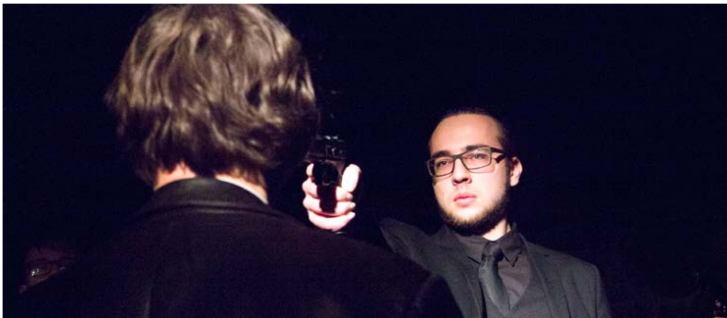
Alternativně pojatý autorský kousek představil alternativní rožnovský soubor Nahé divadlo.