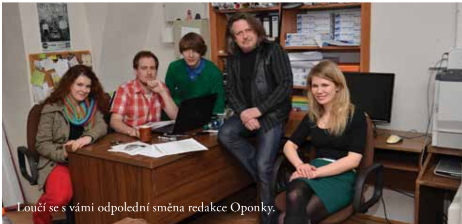
Loučí se s vámi odpolední směna redakce Oponky.

FOTOGRAFIE, ZPRAVODAJE A AKTUÁLNÍ INFORMACE NALEZNETE NA: