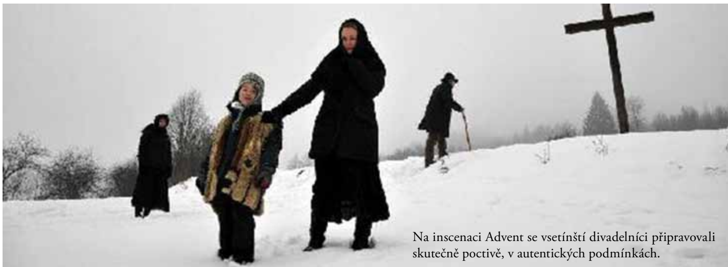
Na inscenaci Advent se vsetínští divadelníci připravovali skutečně poctivě, v autentických podmínkách.