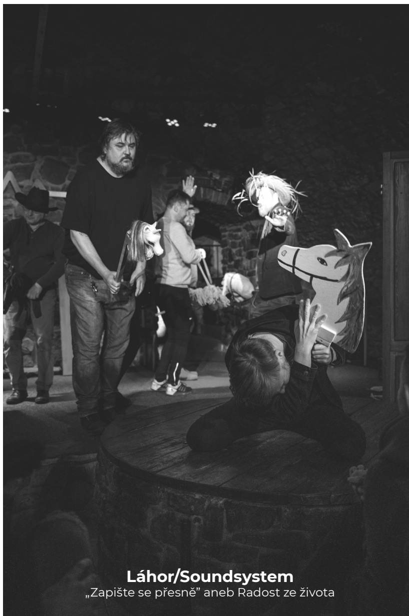
Láhor/Soundsystem „Zapište se přesně” aneb Radost ze života

zečky je znovu velmi sexy, soudí porotkyně. Cena diváků to podtrhne u Žen. Tedy rusovlasý sukces ve dvou rolích. Porota znovu hledá břehy improvizace. Nebyl by lepší pevný text, ptá se nový předseda sudích Lukáš. Hra nakonec podle poroty trochu poztrácela naléhavost v příliš doslovném konci. Kam se vytratilo tajemství? Soubor na porotu zapůsobil, ptáci zahníždili v srdci publika. Radostné pohledy poroty, které patří díky. Ocenění herců z konkurenčních improsouborů si říká o cenu fair play Emila Zátópka. Když nemůžeš, přidej víc. Potlesk v sále.