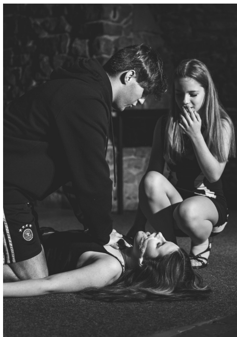
Cena poroty za divadelní debut souboru DIV-ocí lenochodí