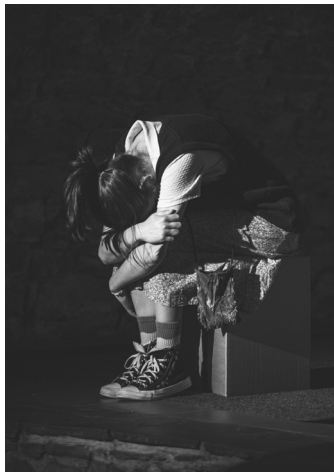
Ocenění poroty s doporučením na Mladou scénu za inscenaci Kéž by... souboru Červiven