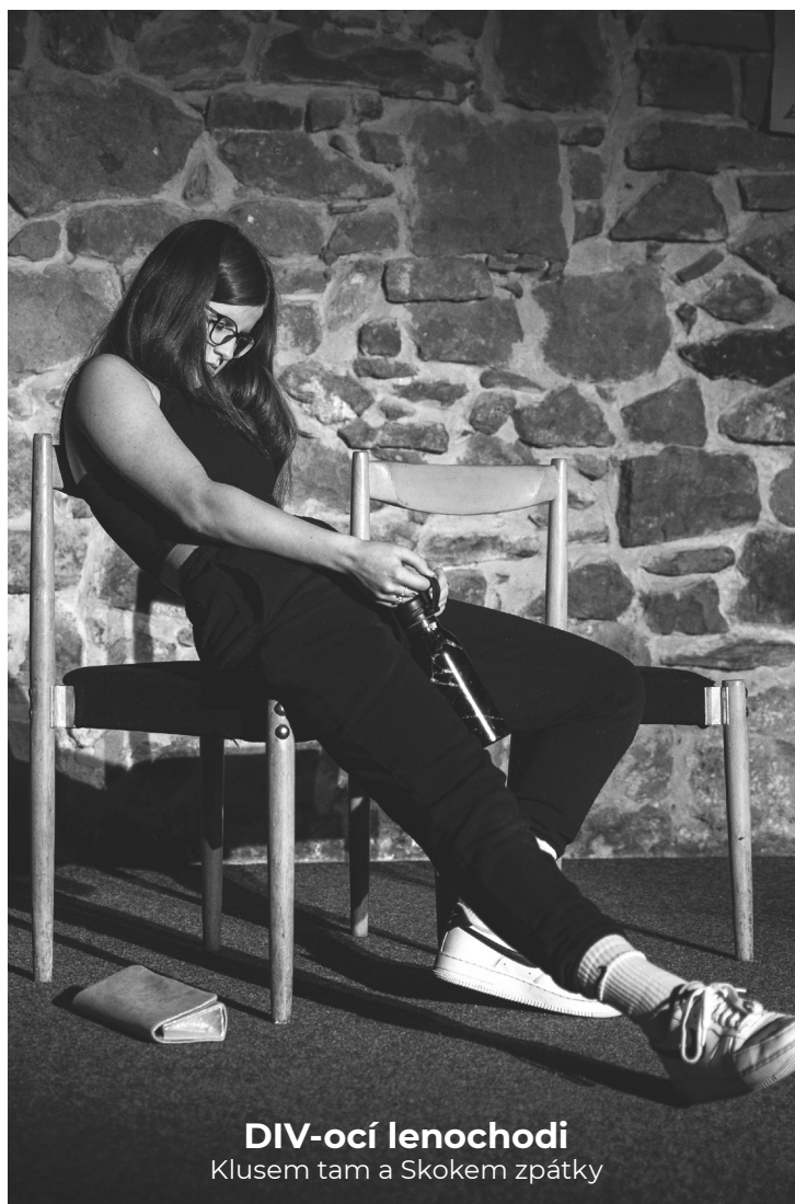
DIV-ocí lenochodi Klusem tam a Skokem zpátky