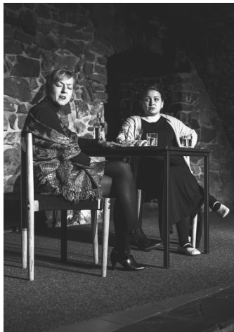
Ocenění poroty s doporučením na Šrámkův Písek za inscenaci No představ si! souboru Ženy ft. Uhřík