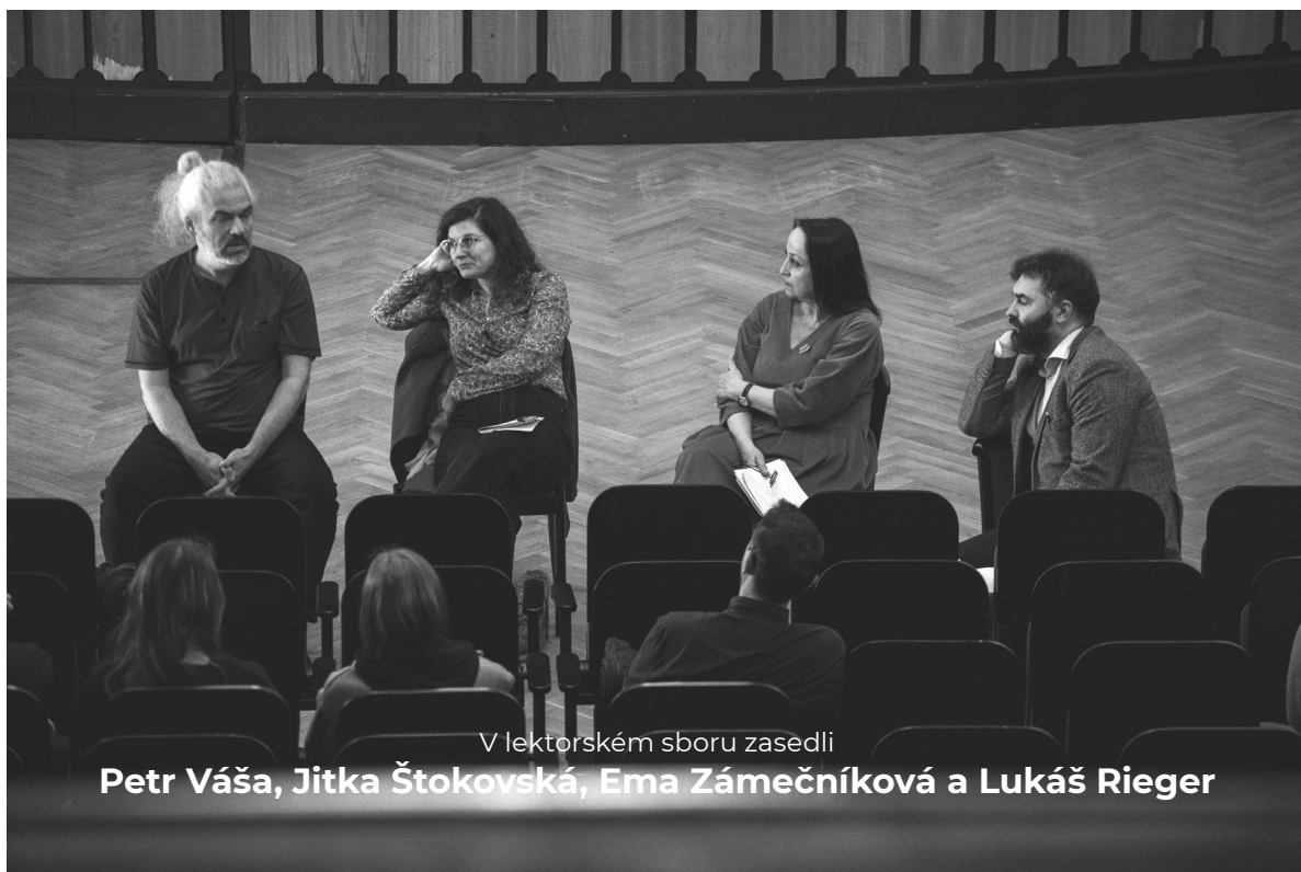
V lektorském sboru zasedli