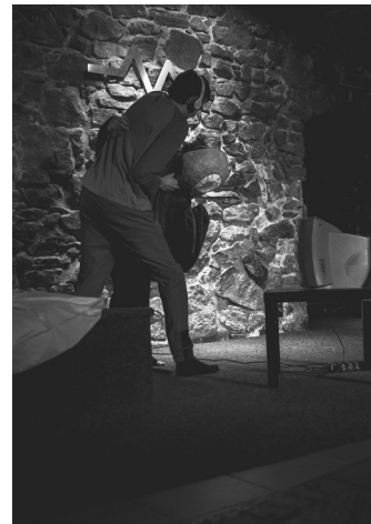
Ocenění poroty s doporučením na Šrámkův Písek za inscenaci Ptáci souboru NJ ft. Uhřík